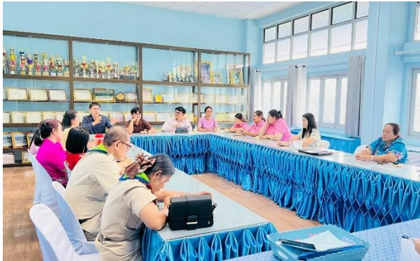
คณะกรรมการประกันคุณภาพภายในและคณะครู ร่วมกันประเมินผลการดำเนินงานของแต่ละมาตรฐาน และตัวบ่งชี้ตามที่กำหนดในแผน