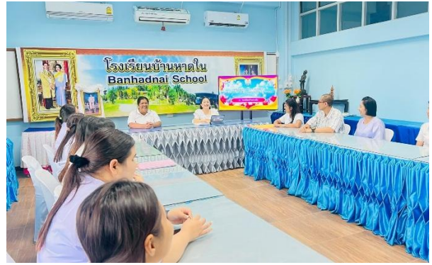
การสรุปผลและจัดทำรายงานการประเมินตนเอง (SAR) ประจำปี