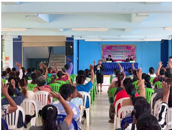
การเปิดเผยข้อมูลและรับฟังข้อเสนอแนะ