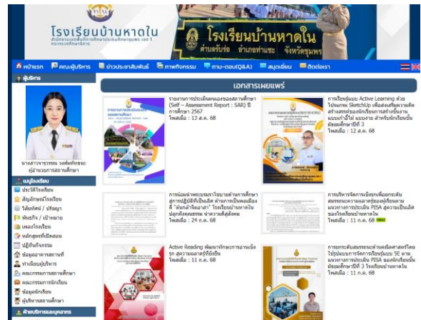
นำรายงาน SAR ไปเผยแพร่ต่อสาธารณชนบน เว็บไซต์ของโรงเรียน หรือช่องทางอื่น ๆ เพื่อให้เกิด ความโปร่งใสและสร้างความรับผิดชอบ